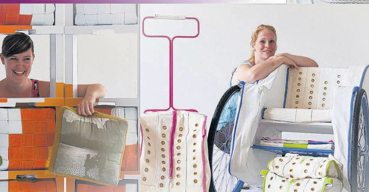
Kunstenaren maakten met onrustbanden kunstobjecten die te zien zijn bij de expositie 'Niet fixeren is een kunst' in verpleeghuis Kalorama. Het is een tentoonstelling over meer bewegingsvrijheid voor mensen met dementie.

te blijven bewegen, vertraag je dit afbraakproces." Kortom: „Die praktijk van het fixeren is één grote paradox als het om het verminderen van het valrisico gaat en ook nog eens fout volgens alle medische richtlijnen." Dat besef is overigens al behoorlijk doorgedrongen in menig verpleeg-